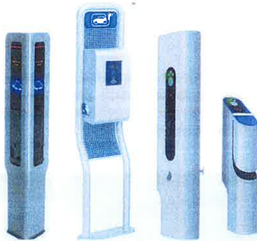
Exemples de bornes de charges existantes

Selon les sites, un nombre ainsi qu'un type de borne de charge ont été proposés. Deux types de charges sont possibles :